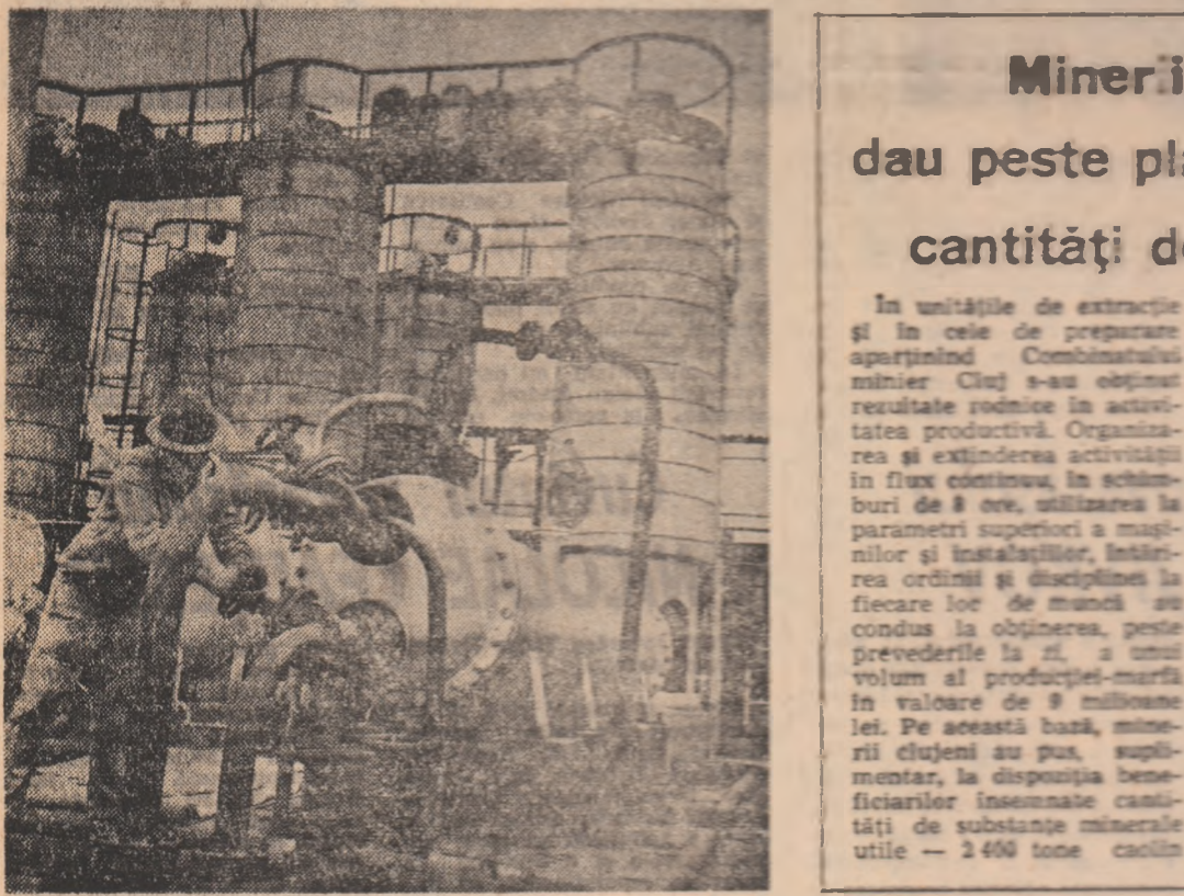
Minerii clujeni dau peste plan însemnate cantități de minereuri.