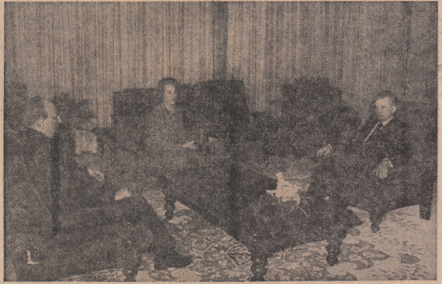
Vineri după-amiază, tovarășul Nicolae Ceaușescu, secretar general al Partidului Comunist Român, președintele Republicii Socialiste România, împreună cu tovarășa Elena Ceaușescu, s-a reîntîlnit cu tovarășul Todor Jivkov, secretar general al Comitetului Central al Partidului Comunist Bulgar, președintele Consiliului de Stat al Republicii Populare Bulgaria.

Înălții oaspeți români în vizită la Combinatul petrochimic de la Burgas