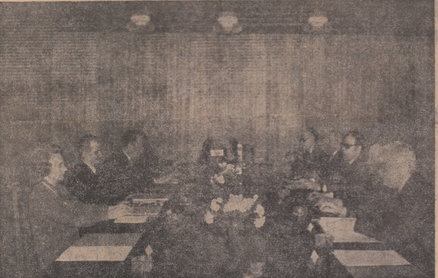
Tovarășul Nicolae Ceaușescu și tovarășa Elena Ceaușescu au apreciat munca desfășurată și au exprimat convingerea că, prin rezultatele ei, această nouă înfrățire la nivel înalt româno-bulgar, a 30-a în ultimii 18 ani, se va înscrie ca un moment deosebit de însemnat în dezvoltarea legăturilor prietenești dintre cele două țări, în interesul cauzei generale a socialismului și progresului, întăririi păcii, destinderii și dezvoltării colaborării internaționale.

Vineri seara, s-au încheiat convorbirile oficiale dintre tovarășul Nicolae Ceaușescu, secretar general al Partidului Comunist Român, președintele Republicii Socialiste România, și tovarășul Todor Jivkov, secretar general al Comitetului Central al Partidului Comunist Bulgar, președintele Consiliului de Stat al Republicii Populare Bulgaria.