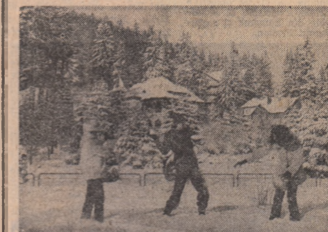
Vă dorm o simbioză și duminică cu munte și apă!