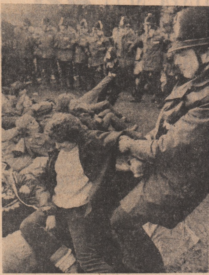
MAREA BRITANIE: O baricadă din propriile lor corpuri împotriva instalării de rachete nucleare cu rază medie de acțiune. La Greenwich Common, au vrut să formeze aceste femei, militante ale mișcării pentru pace. O parte din ele au fost arestate și deferite justiției, deși își apărau doar dreptul la viață...

COPENHAGA 28 (Agerpres). — În Danemarca a luat naștere o nouă organizație a partizanilor păcii, intitulată „Medicii danezi împotriva armei nucleare”. Un purtător de cuvînt al organizației, din care fac parte reprezentanți ai celor mai mari institutii medicale din Danemarca, precum și studenți în medicină, a declarat că obiectivul principal al noii formațiuni este de a explica oamenilor pericolul pe care îl comportă o