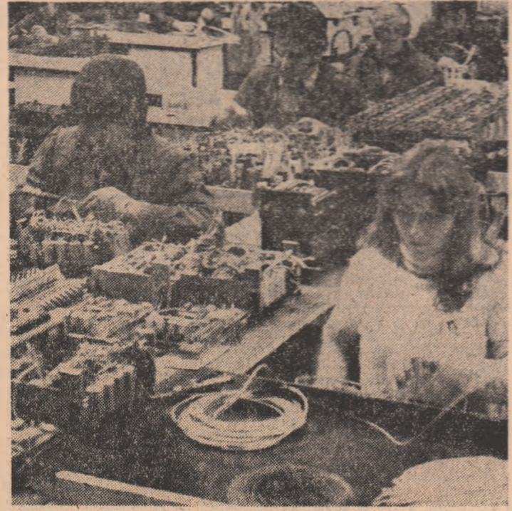
Aspect de la atelierul modele al Întreprinderii Electrotehnica din Capitală

Întreprinderea minieră Lonea, din Bazinul carbonifer Valea Jiului, încheie luna februarie cu cele mai bune rezultate din activitatea sa din ultimii zece ani. Succesul, pe care minerii de aici și-au propus să-l mențină și să-l amplifice în următoarele luni, este urmarea directă a mai bunei organizări a muncii prin trecerea programului de opt ore pe schimb, aplicării unor măsuri ce au condus la simțitoare creșteri ale randamentelor pe post, atât în abataie de mare activitate, cât și la cele „cu front”, la o mai bună ritmicitate la extracție și expediere, precum și la ridicarea calității producției livrate.