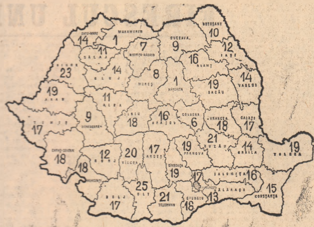
Pe ansamblul țării s-au semănat 804 129 ha, reprezentînd 16 la sută din suprafețele planificate

Urmărind stadiul însămînțărilor de primăvară se reținează faptul că acțiunile trebuie în continuare intensificate, chiar dacă în sudul țării procentele realizate sînt ceva mai mari. Desigur, în zona colinară și mai de nord lucrările au început ceva mai tîrziu, dar și aici forțele trebuie astfel organizate încît semănatul să se desfășoare cît mai rapid, orice intîrziere afectînd din perioada de vegetație și sîngerarea maturității a culturilor. Cît primăvara este mai scurtă — ne referim la timpul