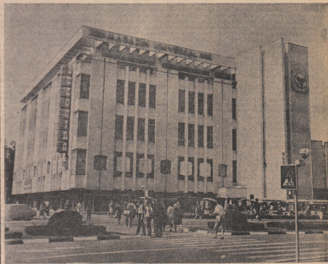
Magazinul universal „Eucovina” din municipiul Succava

În pagina a IV-a DIN ȘI DESPRE VIAȚA ORGANIZAȚIILOR U.T.C.