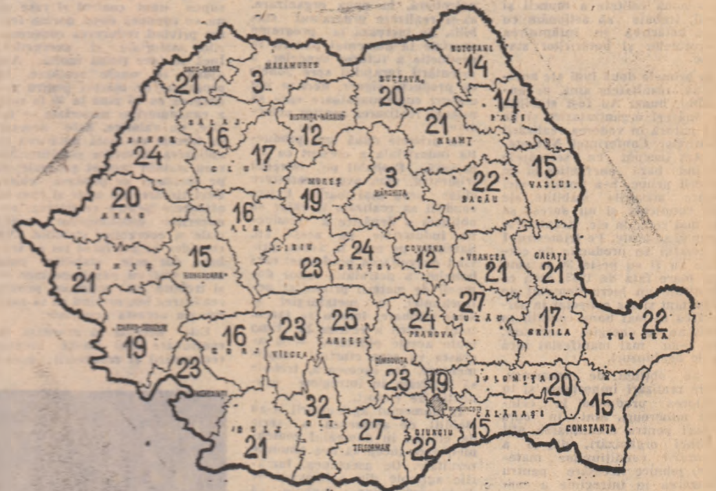
Pe ansamblul țării s-au semănat 1 000 008 ha, reprezentînd 20 la sută din suprafețele planificate

STADIUL ÎNSĂMÎNȚĂRIILOR LA CULTURILE DE PRIMĂVARĂ