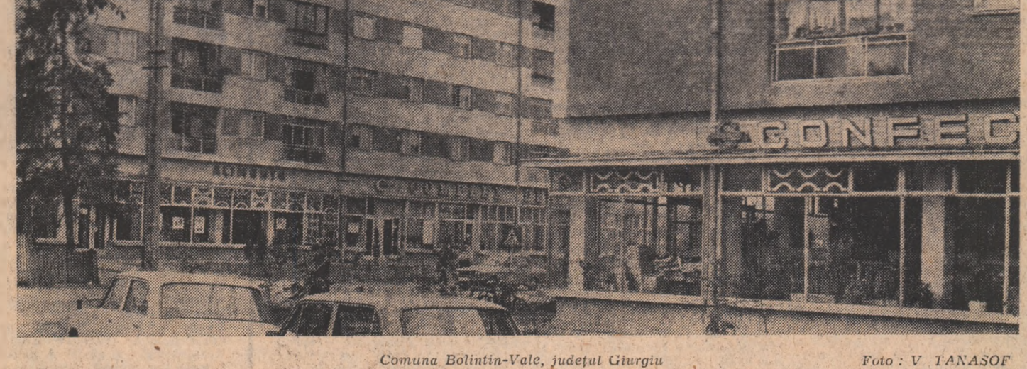
Comuna Bolintin-Vale, județul Giurgiu