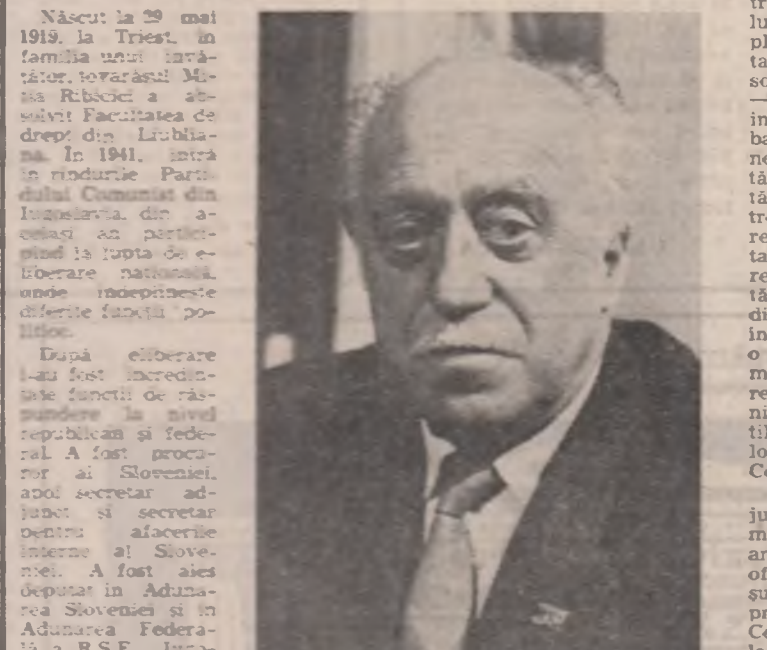
Mitia Ribicici, președintele Prezidiului C.C. al U.C.I.