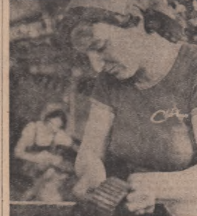
...Căutați în pag. 11-a

Condițiile favorabile de muncă de pe ogoare impun intensificarea acțiunilor prioritare ce se desfășoară pentru obținerea unor recolte sporite în acest an. După ce primăvara a debutat cu rezerve scăzute de apă în sol, ploile survenite ulterior au completat umiditatea, ceea ce a permis realizarea de calitate a însămânțărilor, asigurând factori optimi de vegetație pentru toate culturile. Acționând cu responsabilitate, gospodarii ogoarelor au efectuat semănaul într-un interval mai scurt decât în alți ani, dar în același timp trebuie menționat că la această dată mai sînt încă importante suprafețele de realizat, a căror însămânțare se impune a fi cât mai urgent finalizată. Concomitent, datorită dezvoltării plantelor de cultură, dar și a buruienilor, trebuie desfășurate sistematic lucrările de prăsit și cele de protecție fitosanitară, lucrări care solicită angajarea pe ogoare a unui important volum de muncă. Iată de ce, forțele satului trebuie, în continuare, organizate riguros pentru efectuarea operativă și de calitate a acestor categorii de lucrări care se înseriază și aplicarea unor adunări, mai întâi în grădinițe de legume și în scurt timp și la culturile de cîmp. O recoltă bogată se obține numai aplicînd cu strictețe și în totalitate lucrările agrotehnice pînă la cules, zi de zi.