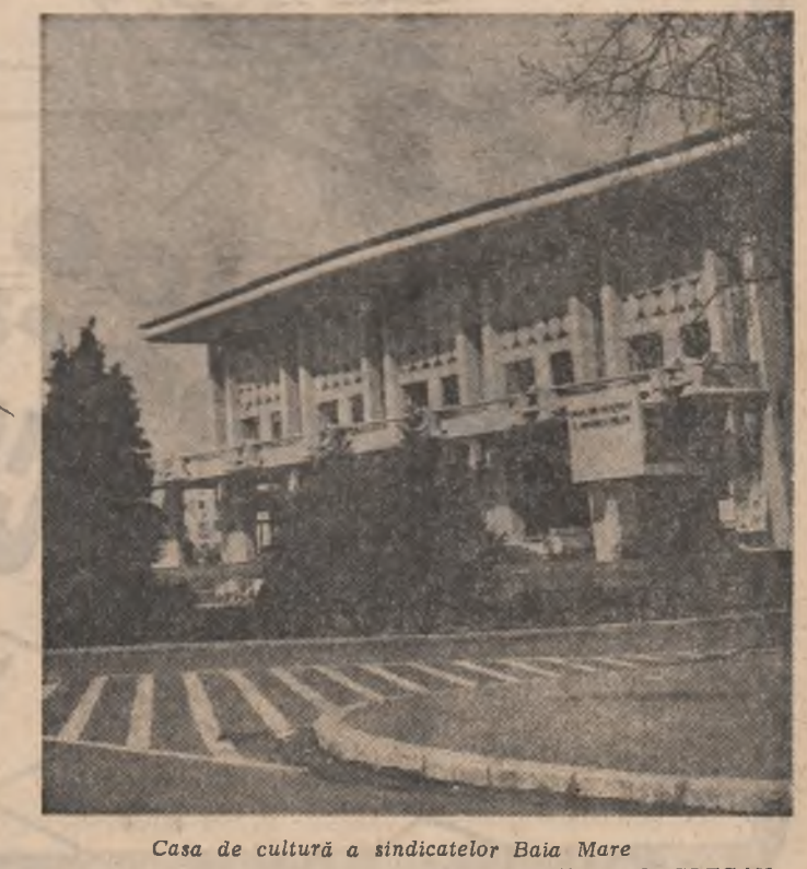
Casa de cultură a sindicatelor Baia Mare