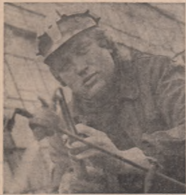
La întreprinderea de știință tehnologică — Buzău