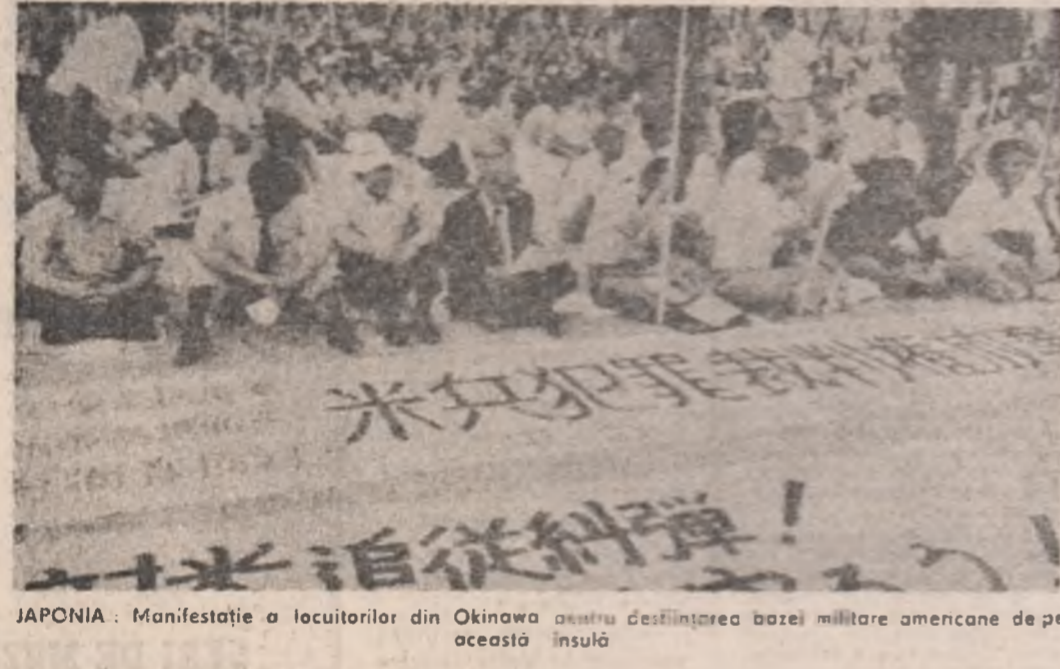
JAPONIA: Manifestația a locuitorilor din Okinawa pentru desființarea bazei militare americane de pe această insulă