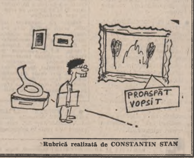
Rubrică realizată de CONSTANTIN STAN

Pînă cînd se vor lura în considerare studiile privind psihologia copilului - care menționează ca un factor limitator reconfortant jucăriile din lemn, față de cele din fier mult mai „agresive” - luăm ceea ce găsim, si pătră că vrem de la aceste jucării si un stimul educativ care să-ă obșnuiașca pe copii cu tehnica, ne orientăm către teleghidate, către mașinile sau aparatura care funcționează în mișnătură după cele cunoscute. Din păcate, încercarea de a găsi o astfel de jucărie în pune nu numai răbdarea la grea covarășă, cele șapte defecte, altele sînt greșite din construcție, altele - o majoritate covrșitoare - nu au... baterii. Simplu, nu? La Bucur-Obor am fost pur și simplu povățuții „dacă vrei ju- cărăi veniți cu bateriile de-acasă”. Mulțumim frumos, un stat mai util nu ne pot da cei preocupăți (contra unei remunerații?)!