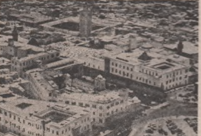
TUNISIA: Imagine din Tunis, capitala țării