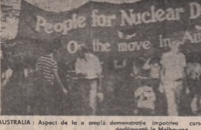
AUSTRALIA: Aspect de la o amplă demonstrație împotriva cursei înarmării, pentru pace desfășurată în Melbourne

BEIRUT 14 (Agerpres) — O persoană a fost ucisă și alte patru rănite în urma incidentelor care au avut loc marți dimineață în orașul Tripoli, din nordul Libanului, între milițiile sîrăciți, informează agentia U.P.I. și France Presse. În cursul luptelor au fost folosite tirurile armelor automate și artileriei, adăugă aceeași surse.