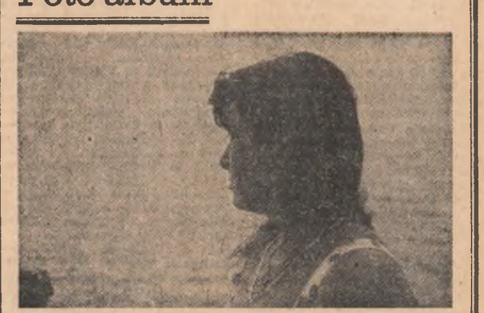
Unii e cîntul mării, la ferm, cu peşnică, înmătător, hotar, fereastră în tîmbrî. Prin care Zeu-Timp şii năruie trifistă. Spre omul, ca si valul, etern neliniştit...