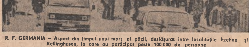
R. F. GERMANIA — Aspect din timpul unui marș al păcii, desfășurat între localitățile Itzehoe și Kellinghusen, la care au participat peste 100.000 de persoane

Cei peste 50 de vorbitori care au luat cuvîntul în sprijinul rezoluției au fost unanimi în sublinierea oportunității adoptării rezoluției și în relevarea contribuției ei constructive, apreciînd că documentul poate fi considerat un adevărat program de acțiune al O.I.M. pentru prevenirea și combaterea șomajului în rândul tineretului, pentru pregătirea prin muncă a unor generații viitoare responsabile.