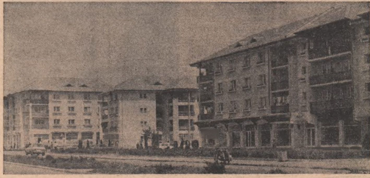
Comuna Scornicești, județul Olt

● CREAȚIA ȘTIINȚIFICĂ ȘI TEHNICĂ DE MASĂ DESFĂȘURATĂ ÎN ÎNTREPRINDERILE INDUSTRIALE ALE SECTORULUI 2 AL CAPITALULUI și la care participă peste 13.000 de muncitori, maștri, ingineri și tehnicieni s-a concretizat din secolul 2 s-au materializat, în perioada care a trecut din acest an, într-o eficiență economică estimată la peste 68 milioane lei. ● HARNICUL COLECTIV MUNCITORESC AL CHIMIȘTILOR număr de invenții și inovații, care vizează în principal reducerea importurilor, diminuarea consumului de materii prime, materiale, energie și combustibili și dublarea productivității muncii, eforturile creatoare ale oamenilor muncii din secolul 2 s-au materializat, în continuare, pe realizarea ritmică a sortimentelor solicitate cu prioritate de economie națională, ei vor livra beneficiarilor, în plus, printre altele produse, însemnate cantități de carbonat de potasiu și oxizilor cuprici.