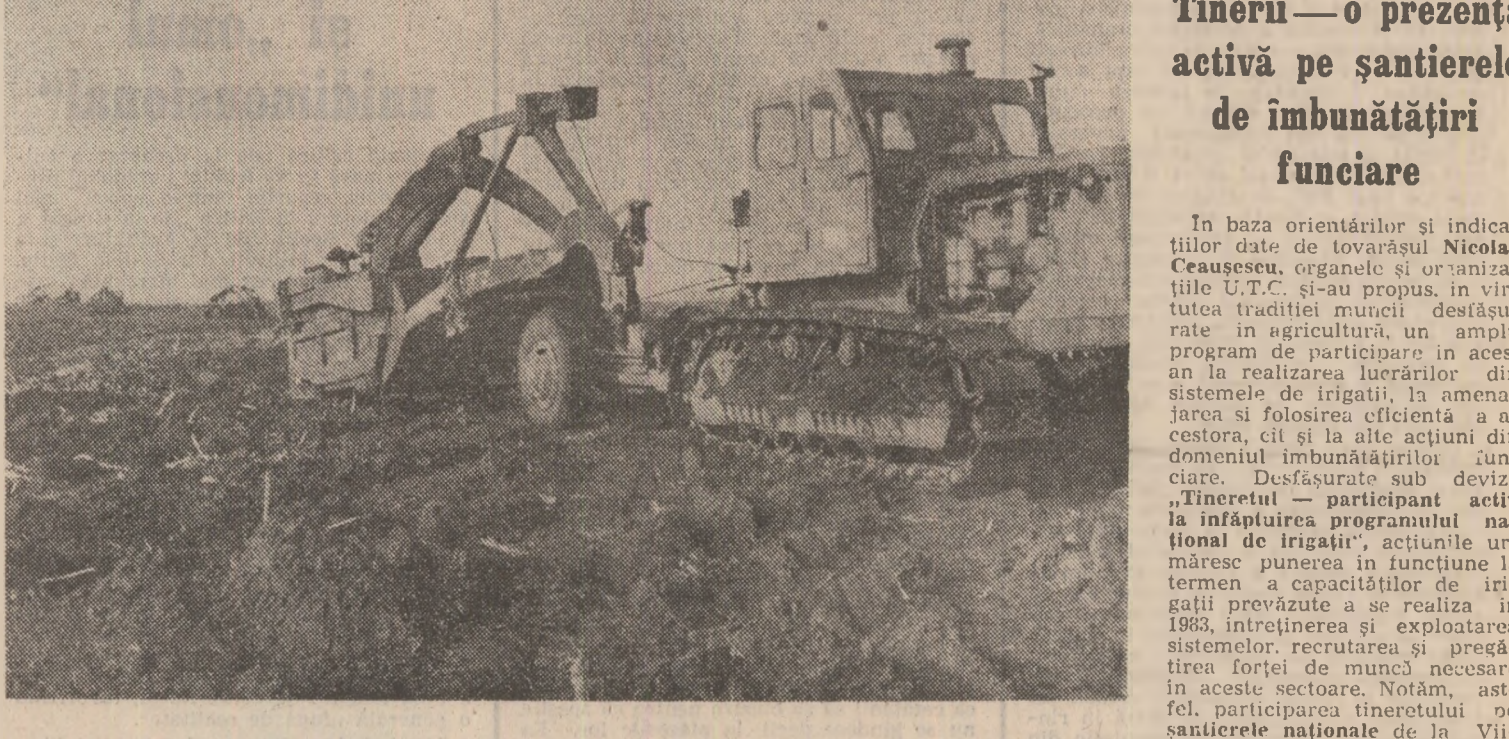
Acțiune concretă, zone în profundă transformare calitativă

„Activitatea pentru realizarea acțiunii programului de dezvoltare a agriculturii și a economiei rurale, care este reprezentată o mare bătaie pentru învingerea unor greutăți provocate de climă, pentru stăpînirea naturii. Avem acum posibilitatea să ne propunem realizarea unor asemenea lucrări, fiind seamă de forțele materiale și tehnice de care dispune societatea noastră socialistă”. Este mult mai decît evident faptul că importantul volum de lucrări destinat îmbunătățirii funciare nu se poate realiza decît prin participarea activă a întregii țărănimii, a tuturor oamenilor muncii din agricultură, a industriei, a comerțului, a învățămîntului, a tineretului, armatei și forțelor de muncă din toate regiunile țării. Se vor realiza lucrări hidroameliorative și de introducere în circuitul agricol a unor importante terenuri în Delta Dună-