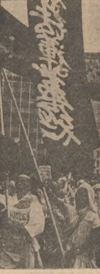
Demonstrație desfășurată în Tokio împotriva escaladării cursei înarmărilor nucleare

BONN 10 (Agerpres) — La Dortmund a început „Marsul păcii '83” la care participă membri ai unor organizații de lup-