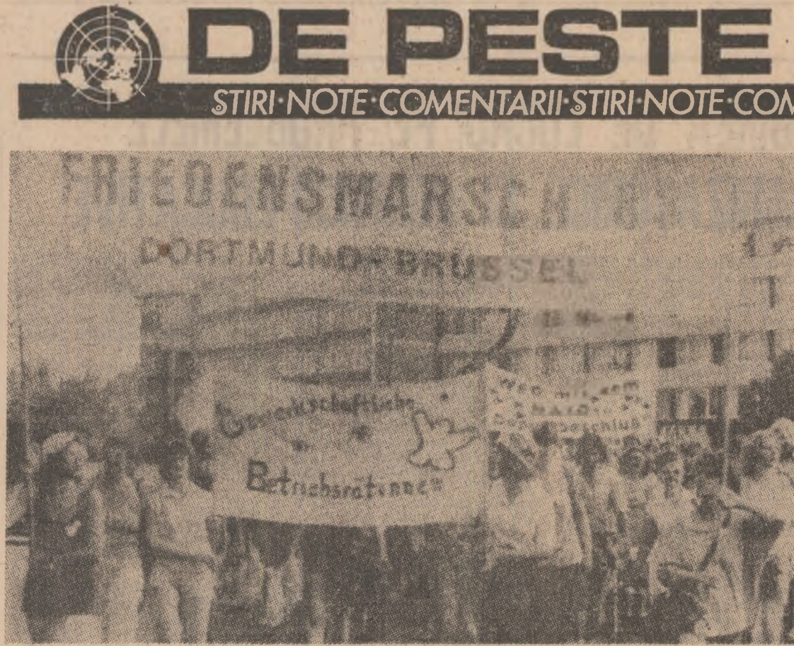
Marșul păcii '83, de la Dortmund din Bruxelles, una dintre numeroasele acțiuni de protest împotriva intenției N.A.T.O. de a amplasa noi tipuri de rachete în Europa, a cuprins în rândurile sale mii de tineri, care și-au exprimat astfel dorința lor de a trăi într-o lume a păcii

WASHINGTON 3 (Agerpres). — În pofida cererilor insistente ale opiniei publice americane de încetare a curselor inamurilor și trecerii la dezarmare, costul programelor de înarmare ale Pentagonului a crescut în trimestrul doi al acestui an, cu aproape 67,8 miliarde de dolari, prin includerea unui număr de 11 programe noi — relevă un raport de Securitate publicat în Washington și reluat de agenția Associated Press. În total, Pentagonul finanțează anul acesta 64 de programe de înarmare, al căror cost se ridică la suma-record de 606,6 miliarde de dolari.