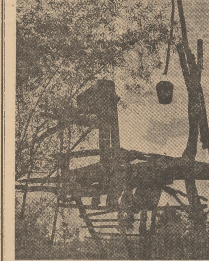
Intr-adevar o... cumpănă!