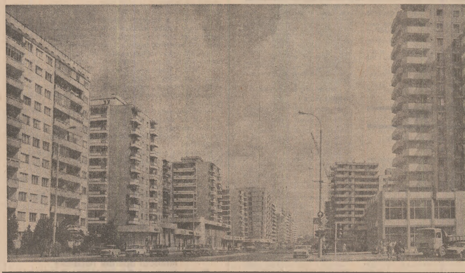
Pagină realizată de ION D. CUCU

România, în strategia dezvoltării sale economice, acordă o mare atenție extinderii și adîncirii relațiilor economice cu tot mai multe state, pe baza principiilor egalității, avantajului reciproc, respectării independenței și suveranității naționale, participînd activ la diviziunea internațională a muncii și schimbul mondial de valori, condiții indispensabile ale propriei dezvoltări economico-sociale. ● Țara noastră întreține în prezent relații comerciale cu 150 de țări (față de 98 de state cu cite întrețineam relații economice în 1965). ● În perioada 1950-1981 comerțul exterior a crescut de 41 de ori — exportul a crescut de 45 de ori, iar importul de 37 ori. ● Țările socialiste dețin o pondere însemnată în structura comerțului exterior românesc, la nivelul anului 1981, în totalul comerțului nostru extern, aceste țări deținînd 43,6 la sută, din care 38,3 la sută statele membre ale CAER. ● În structura exporturilor românești s-au produs modificări deosebite, cu precădere în favoarea produselor cu grad ridicat de prelucrare, ponderea acestora (mașini, utilaje, mijloace de transport, produse chimice, îngrășăminte, cauciuc, bunuri industriale de larg consum) ridicîndu-se la circa 55 la sută din volumul total al exportului, comparativ cu 7,2 la sută în 1950 și 36,2 la sută în 1965. ● România se numără astăzi printre cei mai mari exportatori de utilaj petrolier (locul 3) după U.R.S.S. și S.U.A. și de produse chimice (locul 10) din lume.