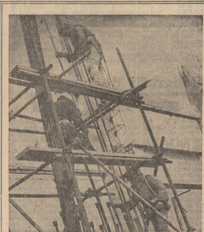
LA C. U. G. - IASI

ORGAN AL COMITETULUI CENTRAL AL UNIUNII TINERETULUI COMUNIST