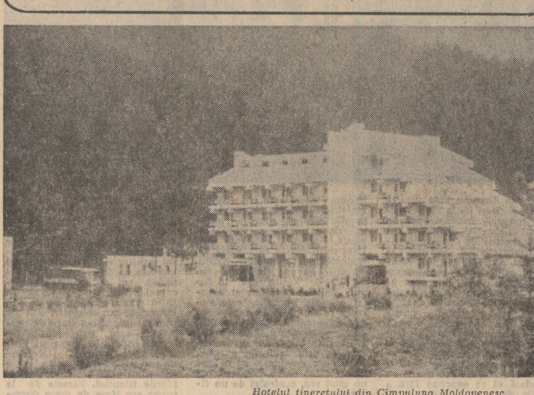
Hotelul tineretului din Cimpulung Moldovenesc

Toți ca unul, unul ca toți, tineri și vîrstnici, români maghiari, germani și de alte naționalități, în orașe și sate, de pe întreg cuprinsul țării, am trăit în aceste zile la cele mai înalte cote ale mîndriei și demnității patriotice, ale angajării și responsabilității revoluționare, momentele sărbătorești ale celei de-a 39-a aniversări a revoluției de eliberare socială și națională, antifascistă și antiimperialistă. În strînsă, în destrucibilă unitate, în jurul partidului, al secretarului său general, tovarășul NICOLAE CEAUȘESCU, cîtorul genial și conducătorul încrecat al noilor destine ale patriei, am reamintit cu sentimentul datoriei împlinite marile noastre realizări și izbînză dobîndite pînă în prezent, așa cum, în spiritul de profundă responsabilitate cu care muncesc și gîndesc comunistii, am văzut și mai bine ce trebuie să facem, ce putem să facem pentru înfăptuirea cu succes a hotărîrilor Congresului al XII-lea și Conferinței Naționale ale partidului, pentru ca România să urce și mai înalt pe cele mai înalte culmi de progres și civilizație.