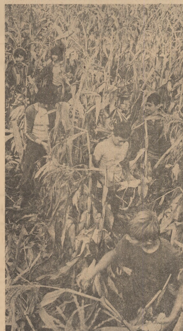
În bilanțul operativ pe care sîmbătă, 24 septembrie, la ora prînzului Comitetul municipal Turnu Măgurele al U.T.C. îl întocmese, figurau, conform glosarilor Comandamentului județean al campaniei agricole, 4500 de elevi participanți în această serie a marilor bătălii pentru stringerea la timp a întregii recolte. În aceeași zi, Comandamentul județean a transmis sarcina suplimentară acestei forțe cu încă 1400 de participanți. M-am desprîrit de interlocutorii mei, în timp ce întocmeam noi programe de acțiune, noi scheme de mișcare. În Teleorman, ca în întreaga țară, bătălia recoltei continuă și, pe largile sale fronturi de acțiune, puternicul detașament al purtătorilor de matricolă, al elevilor pionieri și uteciști, se afirmă din plin, cu responsabilitate, devotament și energie revoluționară, cu dragoste și încredere, spre tot mai bogata lor împlinire în coordonatele generoase ale împlinirii întregii țări.