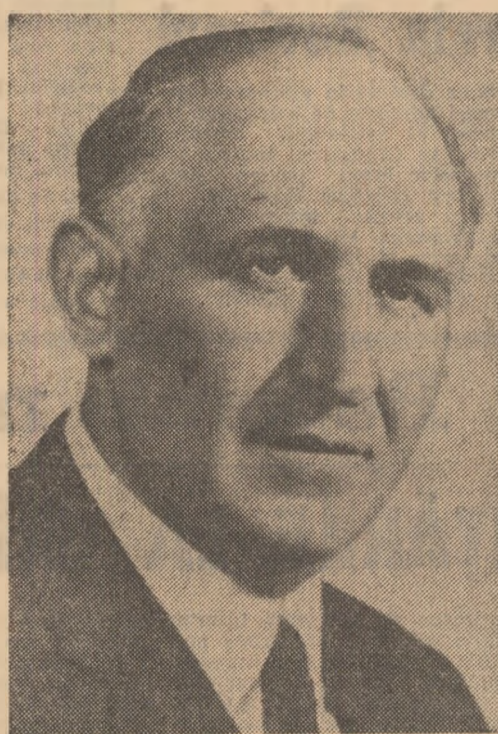
Tovarășul Todor Jivkov, secretar general al Comitetului Central al Partidului Comunist Bulgar, prezidentele Consiliului de Stat al Republicii Populare Bulgaria.

Animat de profunde sentimente de simă și prețuire, poporul român adresează din inimă înaltului ospete bulgar un călduros și tradițional „Bun venit pe pămîntul românesc!”