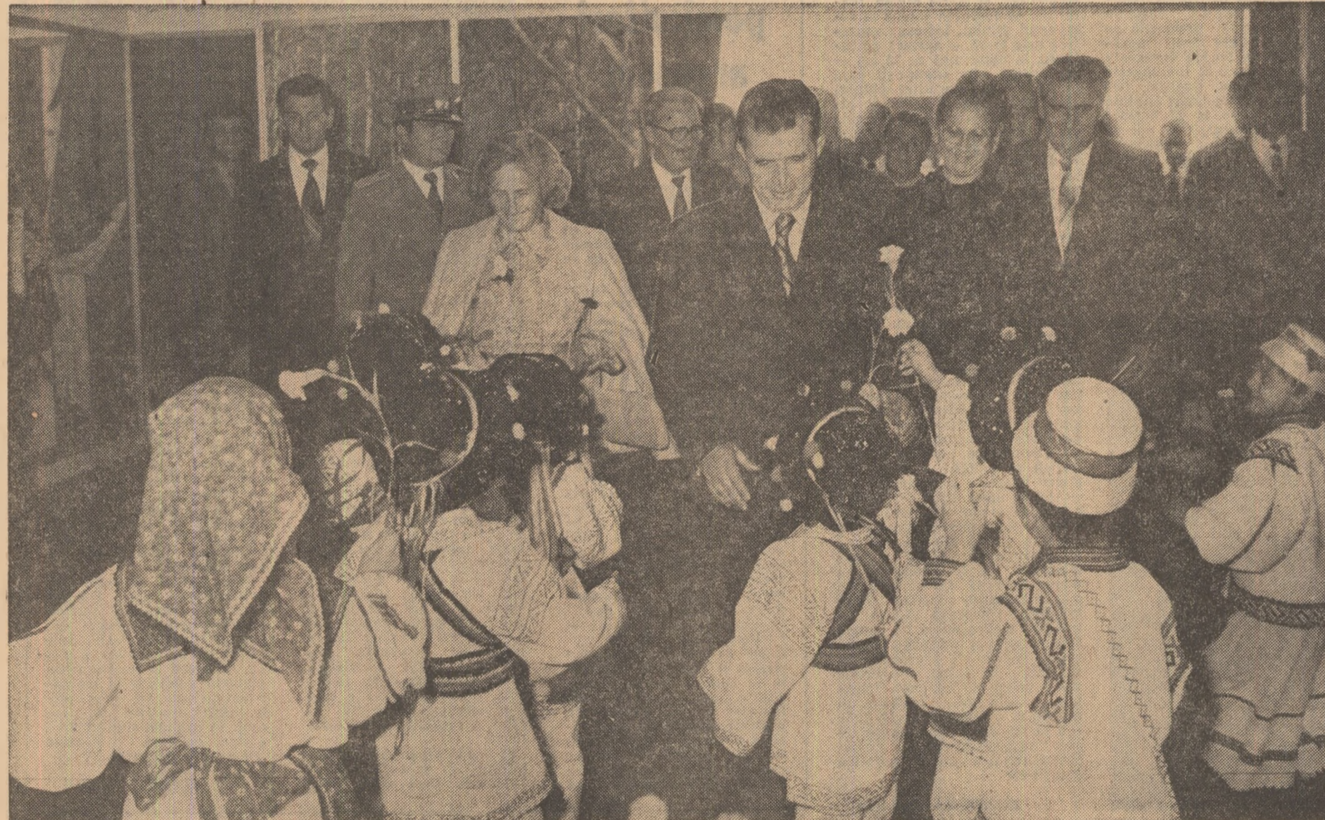
Tovarășul Nicolae Ceaușescu, secretar general al Partidului Comunist Român, prezidentele Republicii Socialiste România, a inaugurat miercuri, 5 octombrie, cea de-a IX-a ediție a Tîrgului Internațional București.

Cunoscut pe plan internațional și consacrat ca unul din tirurile economice cu tradiție, T.I.B. '83 se desfășoară sub devisa „Comerț — Cooperare — Dezvoltare”. Amplă manifestare economică și comercială, T.I.B. ilustrează forța creatoare a oamenilor muncii din toate ramurile economiei naționale, capacitatea industriei românești de a realiza produse de înaltă tehnicitate și performanță, cu un grad superior de competitivitate, posibilitățile în continuă creștere ale României de a participa la diviziunea internațională a muncii, la intensificarea schimburilor și cooperării economice și tehnico-stiințifice, la consolidarea, și pe această cale, a înțelegerii și păcii în lume.