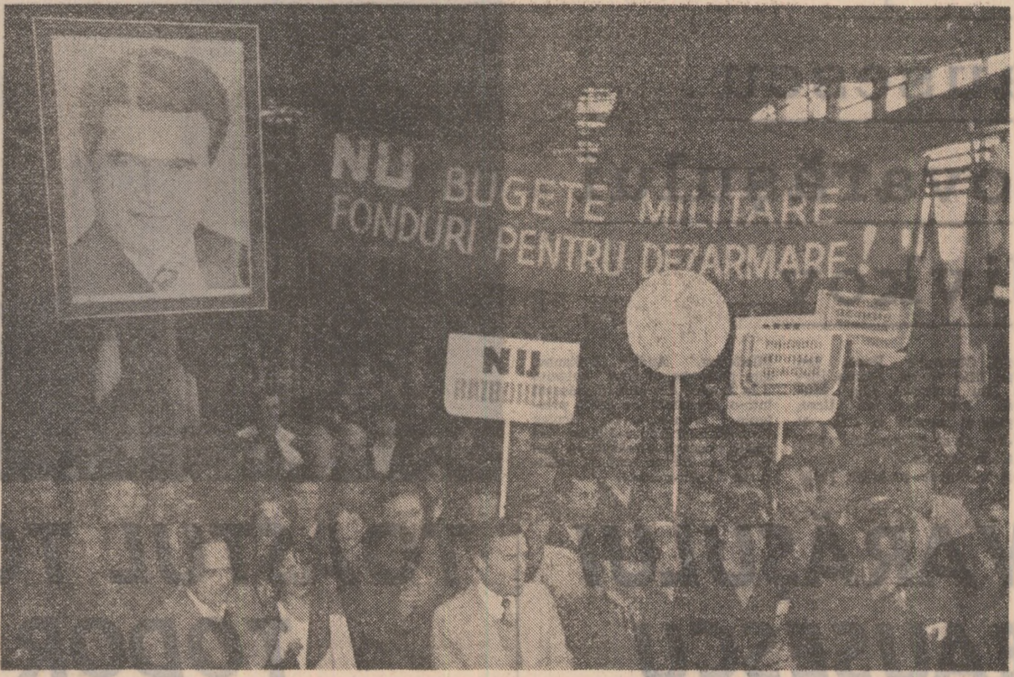
Expunându-ne deplina aprobare față de inițiativa și ideile dumeavoastră, de un înalt umanitarism, să sintem de recunoscători pentru faptul că întreprindeti tot ce este posibil ca poporul nostru să — lueze, să creeze și să învețe în deplină siguranță și pace, alături de celelalte popoare ale lumii.“