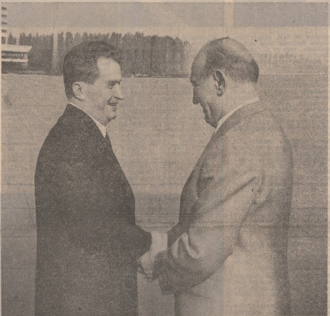
Tovarășii Nicolae Ceaușescu și Todor Jivkov. Ei purtau portretele celor doi conducători de partid și de stat, scandînd cu însuflețire pentru prietenia de

nezdrunțat dintre cele două țări și popoare prietene. Pei orății și urale entuziaste, cei doi conducători de partid și de stat, scandînd cu însuflețire pentru prietenia de