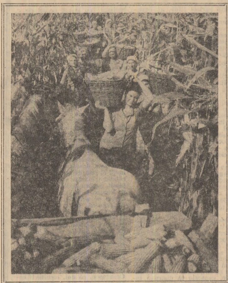
Brigăzile de tineri, împreună cu toate forțele satului, au intensificat în ultima perioadă ritmurile de muncă în câmp (ÎN PAGINA A 3-A)

● Mai multe județe și unități agricole au încheiat culesul porumbului și semănatul grâului, dar pînă la realizarea în întregime a programului campaniei de toamnă pe ogoare mai este de efectuat un volum mare de lucrări ● În continuare trebuie acționat cu toate forțele umane și mecanice disponibile, pe toată durata zilei, la recoltatul și transportul spre depozite și hambare a producției, la eliberarea terenurilor, pregătirea suprafețelor și însămîntarea cerealelor și legumelor de toamnă ● Condițiile meteorologice și lipsa de umiditate din sol impun o atenție deosebită pentru efectuarea de calitate a tuturor lucrărilor de sezon ● Prin acțiuni operative, eficiente tinerii, echipele uteciste angajate pe frontul muncii în agricultură asigură viteze sporite pentru punerea grabnică și fără pierderi a recoltei la adăpost ● În această săptămînă, printr-o amplă mobilizare de forțe și o riguroasă organizare a muncii, marea majoritate a lucrărilor de campanie trebuie finalizate.