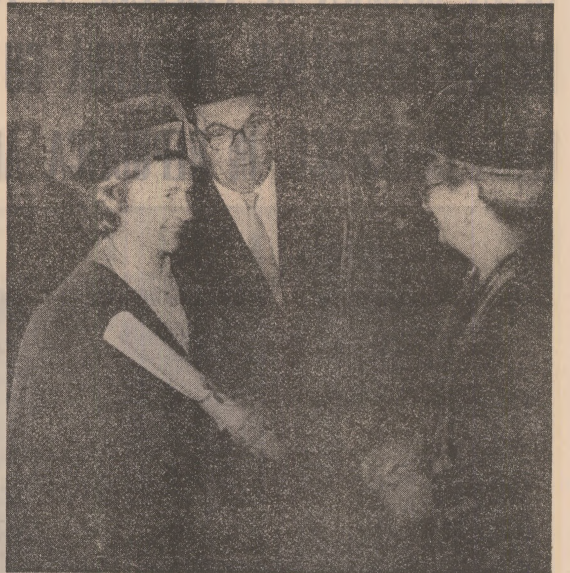
Inceputul festivității a fost marcat prin întonarea imnului de Stat al Republicii Malta.

Eu aș dori — a spus în încheierea președintelui Nicolae Ceaușescu — să vă urez dumneavoastră, sindicatele, industriașii, succes în activitatea pe care o desfășurați, o bună colaborare cu România, să adresez întregului popor prieten maltez cele mai bune urări de prosperitate, de bunăstare și de pace.