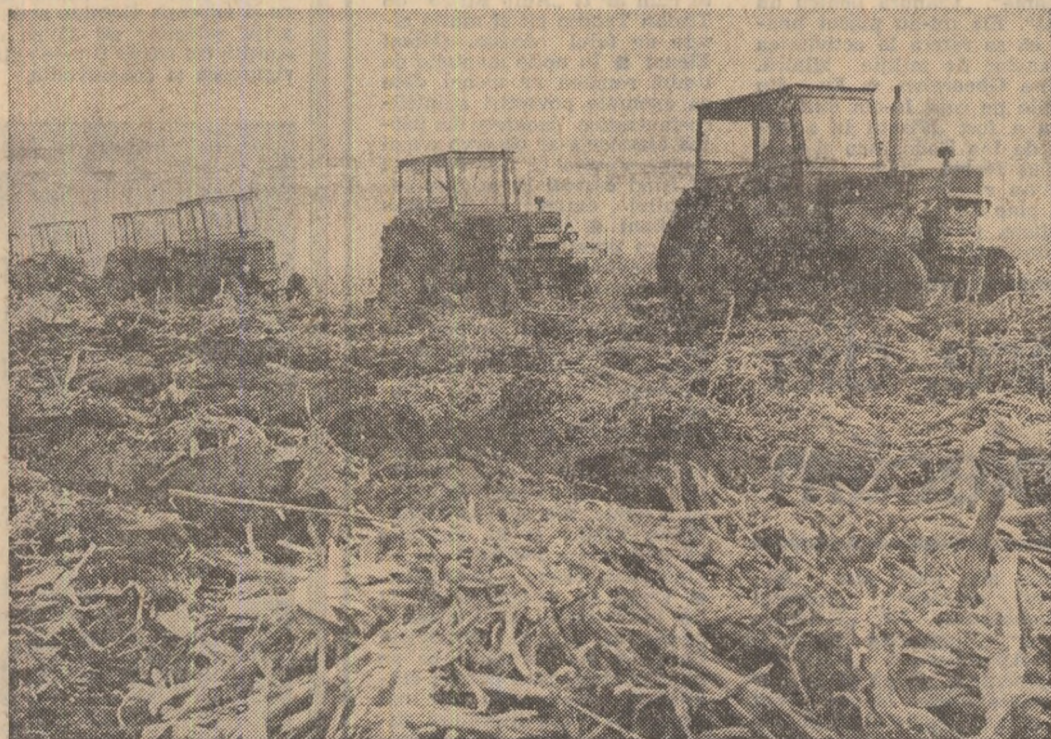
Relatările reporterilor noștri în pagina a IV-a