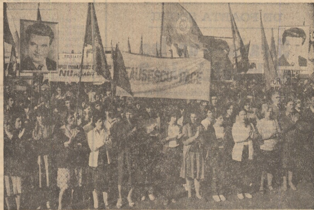
MARI ADUNĂRI ALE OAMENILOR MUNCII PENTRU PACE ȘI DEZARMARE