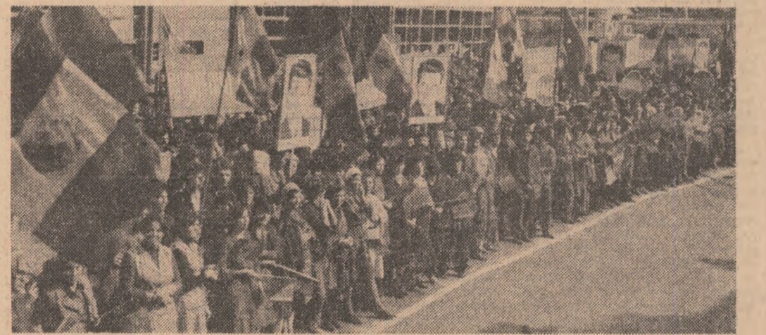
MARI ADUNĂRI ALE OAMENILOR MUNCII PENTRU PACE ȘI DEZARMARE