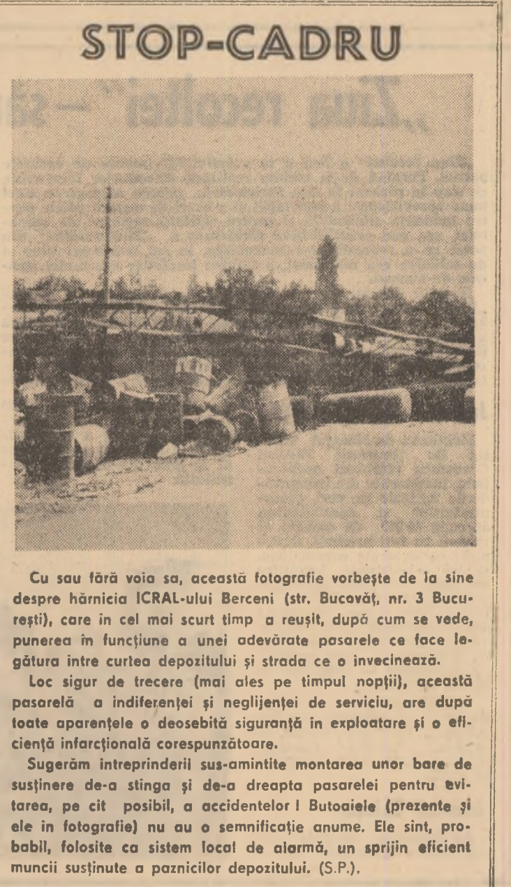
Cu sau fără voia sa, această fotografie vorbește de la sine despre hărnicia ICRA-ului Bercei (str. Bucovăț, nr. 3 București), care în cel mai scurt timp a reușit, după cum se vede, punerea în funcțiune a unei adevărate pasarele ce face legătura între curtea depozitului și strada ce o învecinează. Loc sigur de trecere (mai ales pe timpul nopții), această pasarelă a indiferenței și neglijenței de serviciu, are după toate aparatele o deosebită siguranță în exploatare și o eficiență infarcțională corespunzătoare. Sugerăm întreprinderii sus-amintite montarea unor bare de susținere de-a stînga și de-a dreapta pasarelei pentru evitarea, pe cât posibil, a accidentelor! Butoaiete (prezente și ele în fotografie) nu au o semnificație anume. Ele sînt, probabil, folosite ca sistem local de alarmă, un sprijin eficient muncii susținute a paznicilor depozitului. (S.P.).