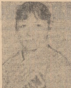
● Ecaterina Szabo — medalie de aur — la sol ● Echipa feminină a României — medalie de argint ● Alte patru medalii de argint și două de bronz — în probele individuale (Relatări în pag. a V-a)

AL GIMNASTICII ROMÂNEȘTI LA CAMPIONATELE MONDIALE DE LA BUDAPESTA MINUNATELE NOASTRE FETE AU CUCERIT 8 MEDALII!