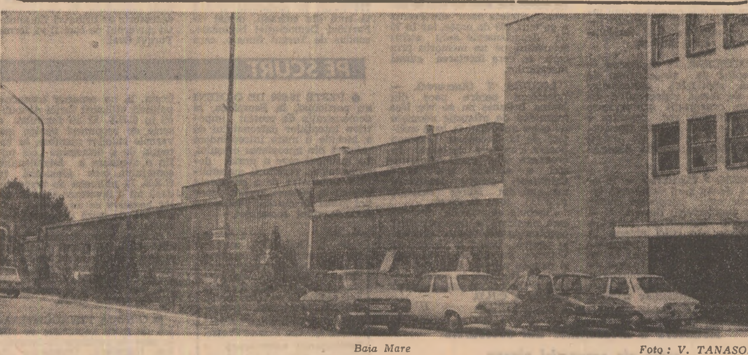
Baia Mare