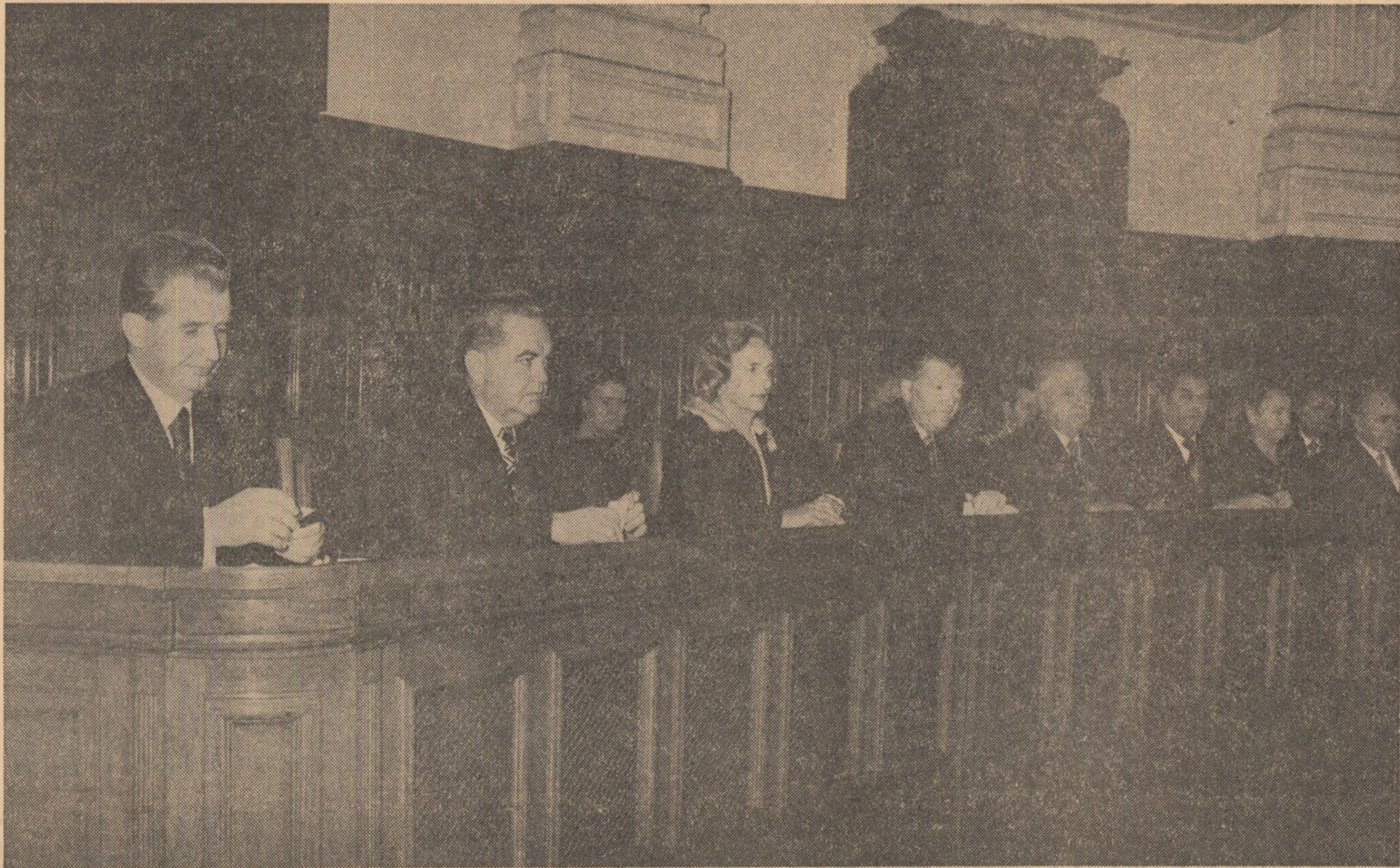
În prezența tovarășului Nicolae Ceaușescu, secretar general al Partidului Comunist Român, președintele Republicii Socialiste România, miercuri, 16 noiembrie, s-au deschis lucrările în

plen ale sesiunii a opta a celei de-a opta legislaturi a Marii Adunări Naționale. Înaltul for legislativ al țării se întrunește într-o perioadă de muncă intensă, în care oamenii