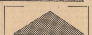
S.U.A.: Tabăra pentru pace a femeilor din orașul Seneca Falls

STOCKHOLM 16 (Agerpres). — Comitetul suedez pentru pace și arbitraj, una din cele mai vechi organizații antirăzboinice din Suedia, s-a pronunțat împotriva instalării de noi rachete nucleare cu rază medie de acțiune în Europa. Amplasarea noilor arme vine în contradicție cu opinia cerurilor largi și a opiniei publice din țările europene care cer încetarea cursei înarmărilor și realizarea dezarmării generale și totale, se arată în apel.