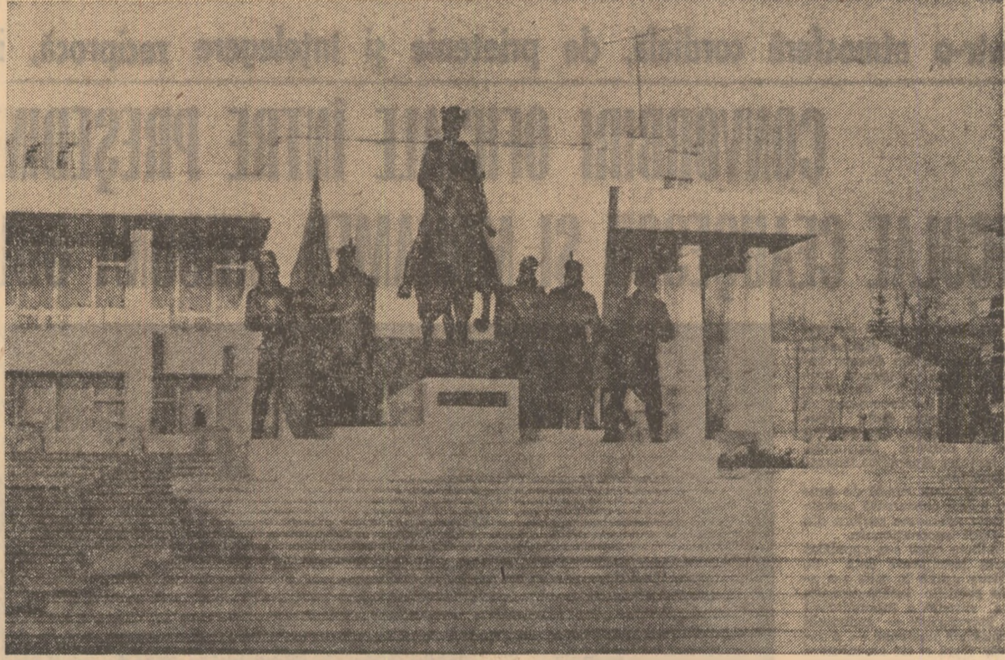
Pagină realizată de IOAN LAZĂR

când, luptând pentru pace, exprimându-ne voința în mari mitinguri, o facem spre a sublinia și mai apăsător voim să apărăm ceea ce înaintașii ne-au lăsat moștenire, o patrie unită, unică, o patrie căreia în această pagină de ziar încă și încă o dată scriitorii tineri îi dedică gândurile lor.