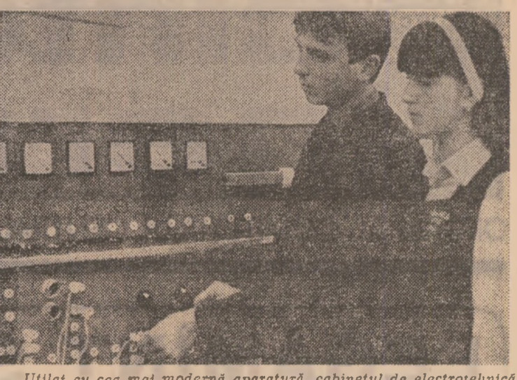
Utilaj cu cea mai modernă aparatură, cabinetul de electrotehnica din cadrul Liceului Industrial nr. 2 — Galați permite elevilor însușirea în bune condiții a materiei predate.