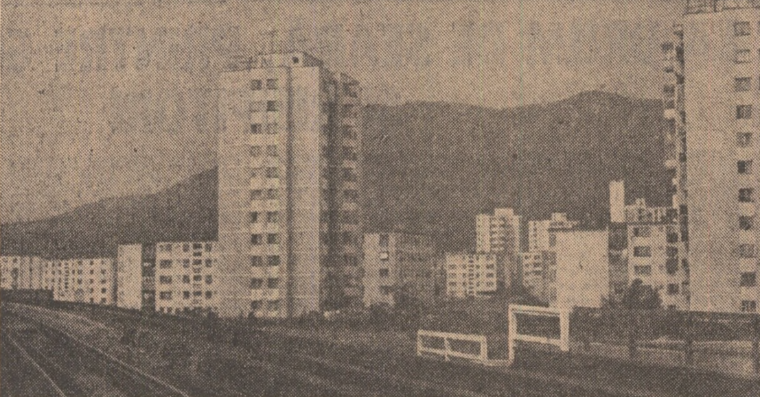
Baia Mare

● Printr-o telegramă adresată C.C. al P.C.R., tovarășului NICOLAE CEAUȘESCU, secretar general al partidului, președintele Republicii Socialiste România, Comitetul de partid și conducerea minei Filipești de Pădure, județul Prahova, anunță obținerea unor succese remarcabile în activitatea productivă. Vă raportăm, mult iubite și stimabile tovarășe Nicolae Ceaușescu, se spune în telegramă, că pe 11 luni am realizat o producție netă suplimentară de 59.300 tone cărbune, iar în data de 6 decembrie a.c. am realizat planul la producția fizică de acest an. Urmind prețioasele dumneavoastră indicații, vom acționa cu toată energia pentru perfecționarea organizării muncii, ridicarea continuă a nivelului de pregătire profesională, politică și ideologică, pentru a continua îmbunătățirea condițiilor de muncă ale oamenilor muncii, preocupări care să se reflecte tot mai mult în realizarea sarcinilor de plan ce ne revin în anul 1984, în întregul sinecrist. Vă asigurăm că nu vom prescupe nici un efort pentru a ridica pe un plan calitativ superior întreaga noastră activitate, conștienți fiind că numai în acest fel ne vom aduce deplina contribuție la dezvoltarea multilaterală a țării, la continuarea înfloririi a scumpei noastre patrii, Republica Socialistă România.