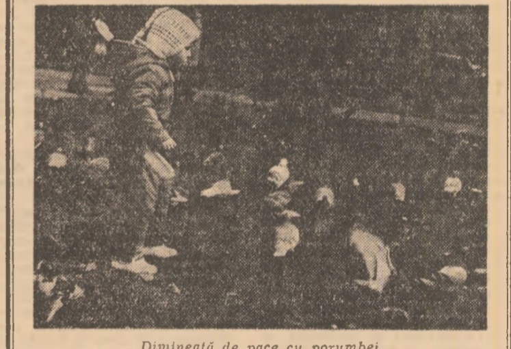
Dimineată de pace cu porumbei.