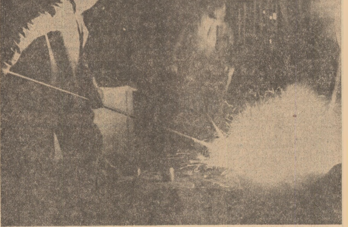
Un deceniu de producție la Combinatul de oțeluri speciale Tirgoviste

parabile cu cele realizate de grupurile de 315 MW de la Iași și cu 80 de MW mai mari decât puterile medii realizate înainte de modernizare, disponibilitatea de timp a blocurilor s-a menținut la un nivel scăzut datorită opririlor accidentale — (20,7—34,9 la sută din timpul calendaristic la Turceni și respectiv 30,9—52,2 la sută la Turceni). — Cum s-a acționat pentru înlăturarea acestor neajunsuri? — Am acordat o atenție deosebită reparațiilor grupurilor energetice pe cărbune, efectuîndu-se 23 reparații capitale, 10 reparații curente și 32 revizii tehnice. Urmare a directă a atenției acordate reparațiilor capitale cu modernizare la blocurile de 330 MW nr. 4—3 Rovinari și numărul 1 Turceni, pe lângă creșterea puterii produse se reduce cu 40 la sută și consumul de hidrocarburi de adăos. De asemenea, la Iași, reparațiile executate la cazanele de 330 t/h și 370 t/h și modernizarea morilor de cărbune și a grătorelor de postare asigură funcționarea la debitul nominal cu cărbune de calitate inferioară. Astfel, starea tehnică bună a instalațiilor ne-a permis să realizăm maximum de producție din noiembrie și avem