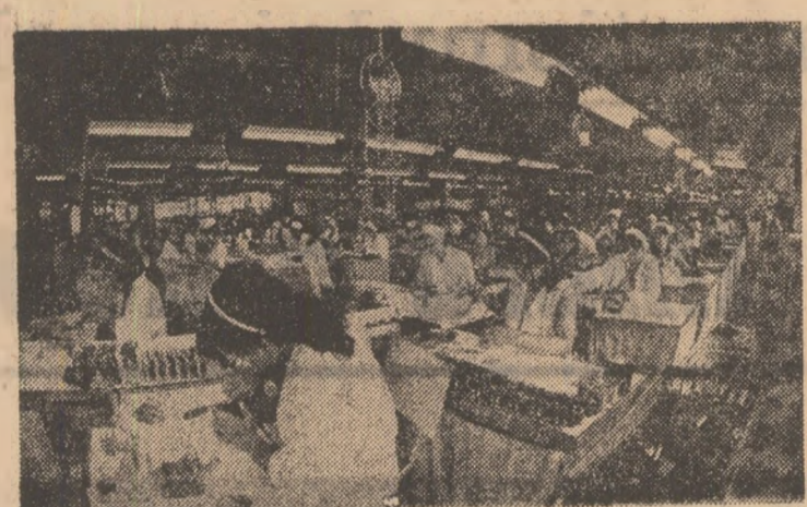
Aspect dintr-o secție a I.A.E.M. Timișoara

Organizația U.T.C. din cadrul I.R.T.A. — 77, Jiu, sub îndrumarea permanentă a organizației de partid și-a propus în planul său de activitate, printre altele, cunoașterea frumuseților patriei, a bogățiilor sale. S-a început cu vizitarea localităților: mai apropiate, Până acum un număr de peste 100 de tineri au vizitat puternicele centre muncitorești din Valea Jiului cum sunt Petroșani, Vulcan, Lupeni, Petrolia, inclusiv orașul Hațeg. Cu acest prilej tinerii au vizitat și locurile de poveră de la cabanele Rusu, Valea cu pesti, Cimpul lui Neaz, Bucura etc. După efectuarea acestor trasee, tinerii au vizitat ocașii minerilor de la Motru, Drobeta-Turnu Severin, Centrula Porțile de Fier I, Orsova, Herculane. După fiecare excursie, în cadrul organizației U.T.C., se poartă discuții referitoare la cele văzute. La Motru, Drobeta-Turnu Severin, acțiunile planificate, la impresia pe care le-au produs-o obiectivele vizitate, stabilindu-se totodată următoarele trasee. Din ce în ce mulți tineri din organizația U.T.C. de la această unitate economică se alătură celor ce doresc să cunoască frumusețile și realizările din țara noastră.