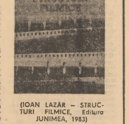
(IOAN LAZĂR — STRUCTURI FILMITICE, Editura JUNIMEA, 1983)