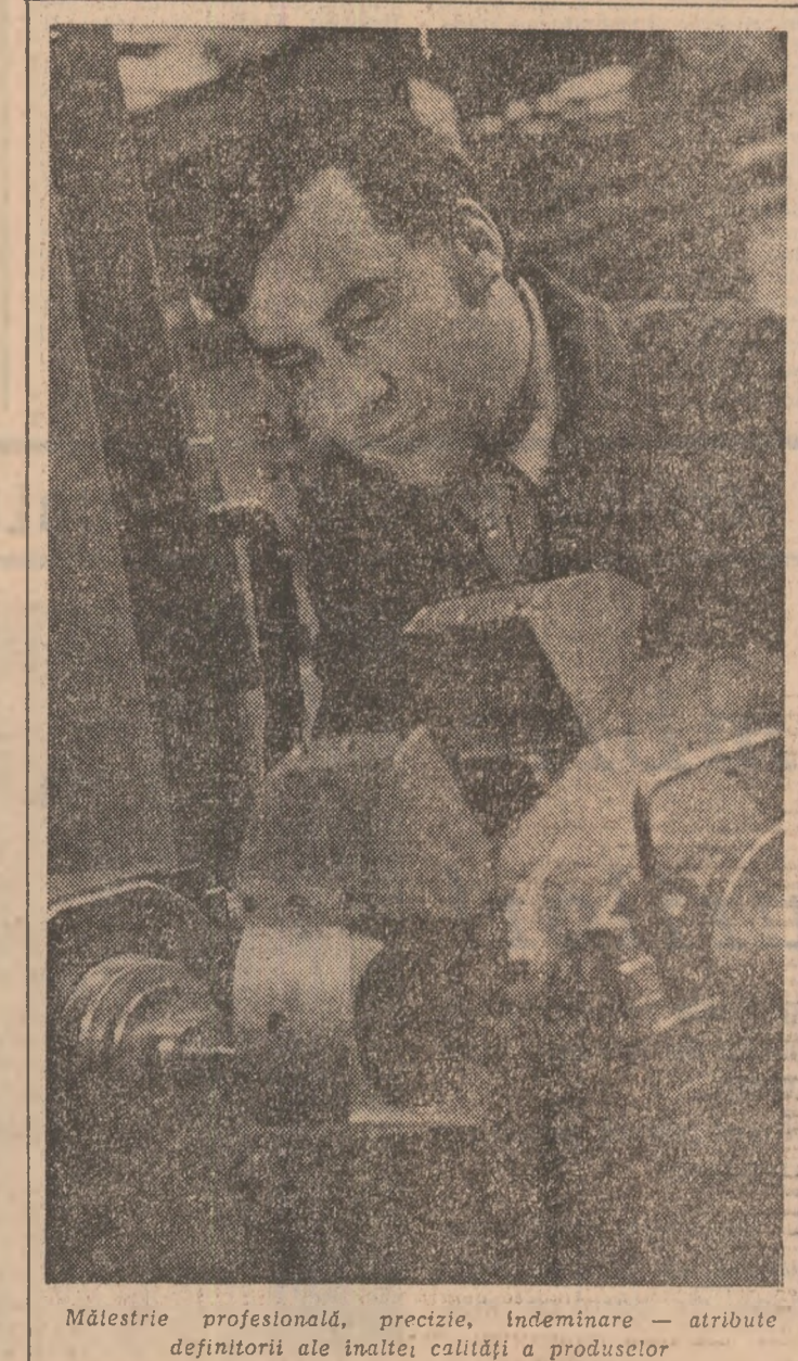
Măstere profesională, precizie, îndemnare — atribuție definitorie ale înaltei calități a produselor

site în întreprindere. O inițiativă recentă vizează policalificarea; e vorba de o acțiune cu devisa „fiecăre tînar să cunoască trei operații”, fapt care va conduce la creșterea productivității muncii și la evitarea unor ruperi de ritm. Avem rezultate foarte bune în această direcție. Avem colective de tineri care își îndeplinesc sarcinile în mod exemplar. Mă gîndesc la organizația nr. 15 a formației de lucru 142 din atelierul 14 — impermeabile de tercot, la formațiile 242 — impermeabile, 124 și 224, toate formate din absolventele de anul acesta ale liceului textil. De re-