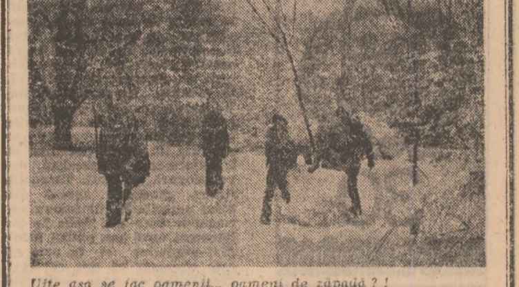
Uite așa se fac oamenii... oameni de zăpadă?