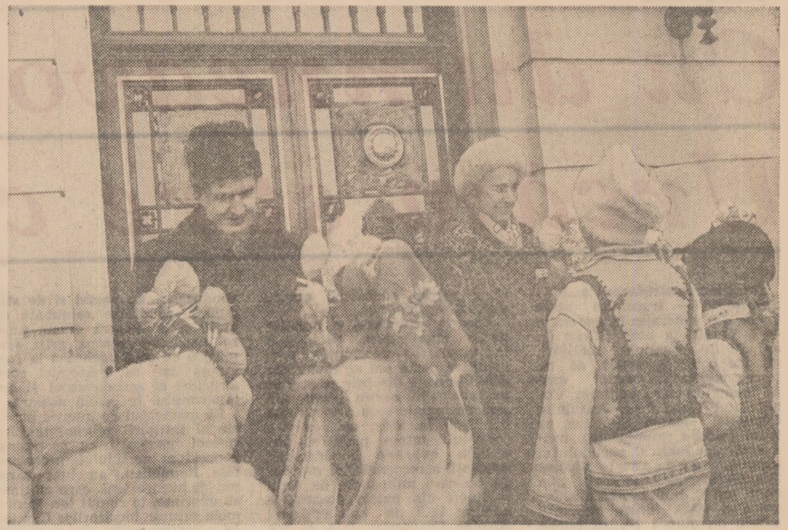
(Urmare din pag. 1)