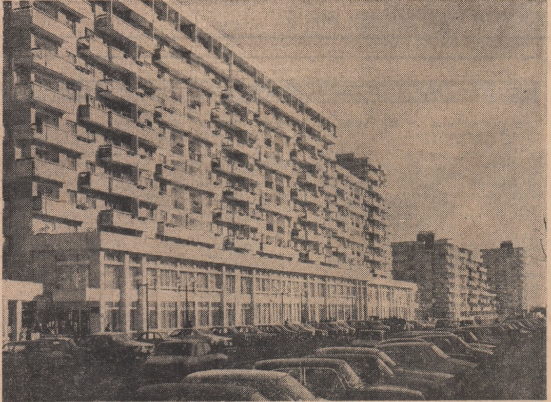
Centrul municipiului Pitești