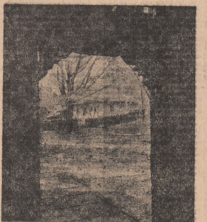
Satul românesc — o poartă către eternitate...