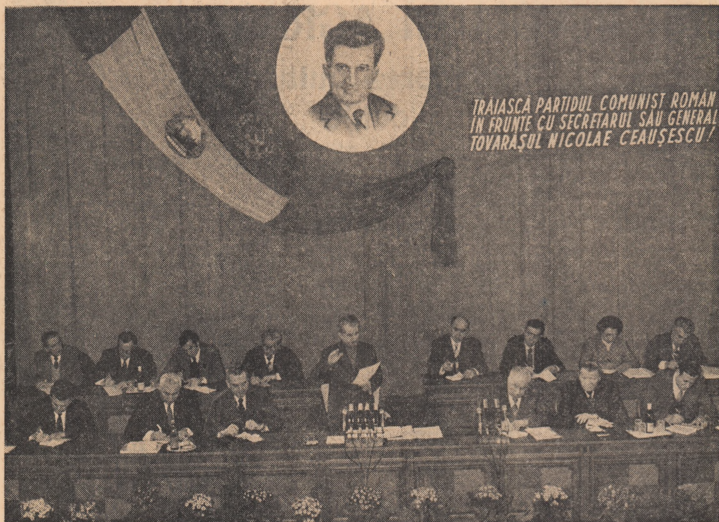
TRAIASCA PARTIDUL COMUNIST ROMAN IN FRUNTE CU SECRETARUL SAU GENERAL TOVARASUL NICOLAE CEAUȘESCU!

Sînt necesare, de asemenea, măsuri hotărâte pentru a asigura sectorului particular și gospodăriilor cooperatiste unele și mijloacele de lucru necesare, precum și îngrășăminte, antidunători și alte substanțe necesare de combatere a diferitelor boli și insecte. Dar și în această pri-