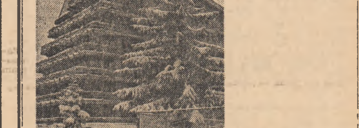
Incă o invitație pe traseele vacanței!