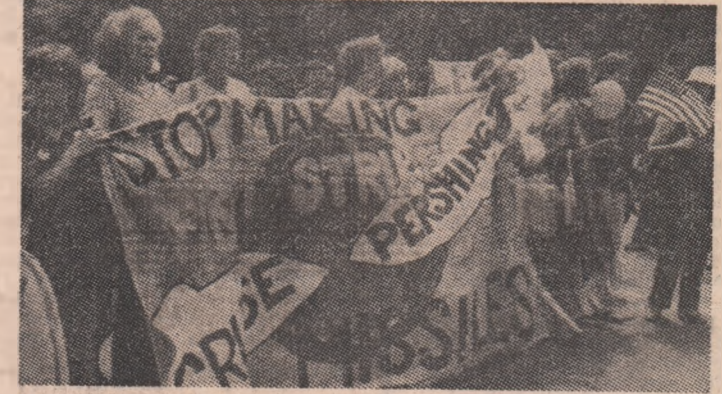
Mii de persoane au demonstrat în fața depozitului de muniții Seneca din New York împotriva dezvoltării arsenalului nuclear al S.U.A., pentru dezarmare și pace

LONDRA 22 (Agerpres). — Suite de persoane au participat la o demonstrație organizată în zona bazei americane de la Holy Loch (Scotia) în semn de protest față de prezența submarinului „Polaris” dotat cu rachete nucleare — informează agenția Associated Press.