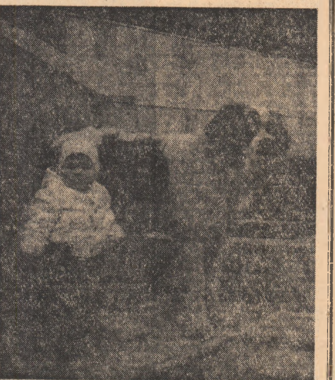
Ce ziceți de prietenul meu?