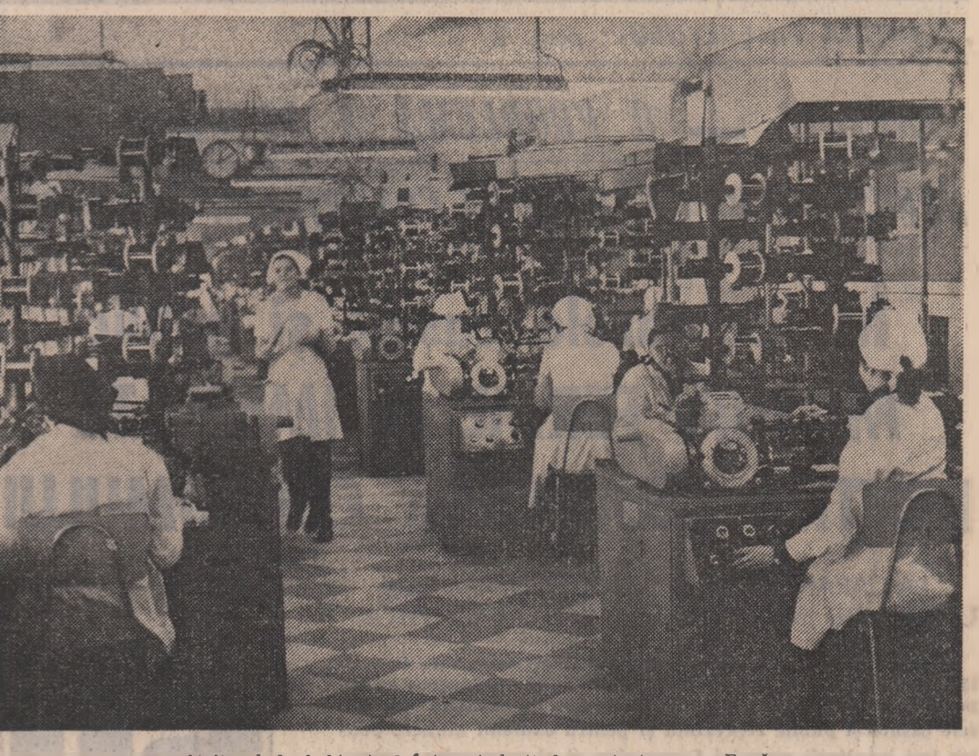
Atelierul de bobinaj al întreprinderii de contactoare — Buzău