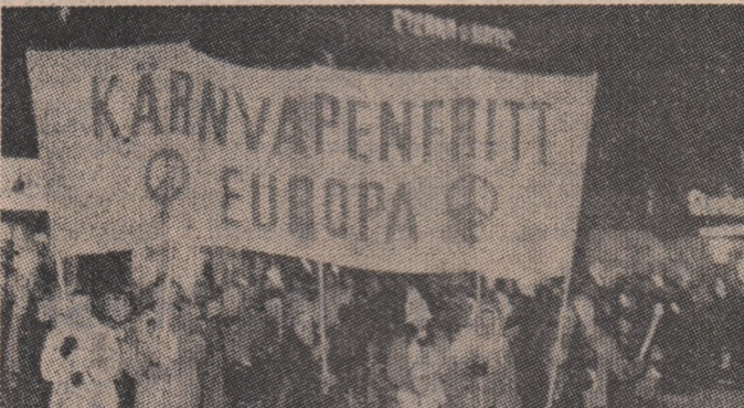
Imagine din timpul unei ample demonstrații desfășurate la Stockholm împotriva pericolului pe care îl antrenează prezența rachetelor nucleare cu rază medie de acțiune în Europa, demonstrații la care au participat numeroși tineri suedezi

BEIRUT 2 (Agerpres). — Situația la Beirut și în zona de munte adiacentă s-a deteriorat joi, odată cu izbucnirea în cursul după-amiezii a unor violente dueliuri de artilerie și rachete care au ucis sute de persoane libaneze, pe de o parte, și milițiile druze și șite, pe de altă parte. Televiziunea libaneză, citată de agenția Reuter, a anunțat că asupra unor cartiere ale capitalei au căzut sute de proiectile de artilerie și rachete. S-au înregistrat numeroși răniți și au fost distruse clădiri din sudul Beirutului.