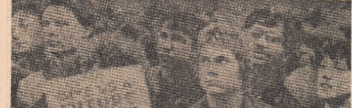
Demonstrație a tinerilor britanici împotriva creșterii șomajului