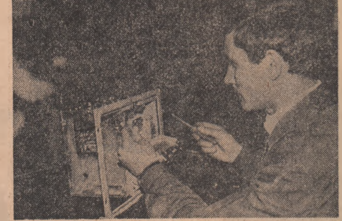
Un lucru este cert — creația tehnico-științifică este o realitate cotidiană. Indiferent că este vorba de profesioniști sau pur și simplu de pasionați ai noului, creativitatea se manifestă precum un factor hotărîtor al progresului, iar faptele de ficcare și conștință că o pondere tot mai însemnată din realizările care au făcut și fac prestigiul științei românești o datorăm tinerilor.