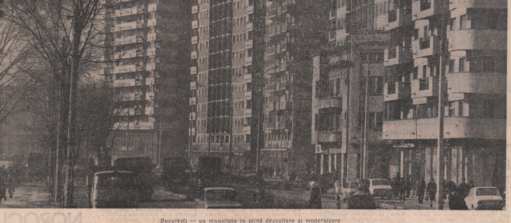
București - un municipiu în plină dezvoltare și modernizare