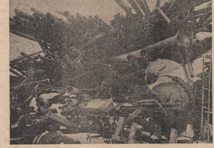
În ceea ce privește țevile din imagine situația lor este și mai clară. Se poate ușor observa că, desi au fost trimise la Uzina Bercești pentru a fi topite, ele pot fi încă folosite fără nici un inconvenient. Evident, cu condiția ca ele să fi fost sortate încă de la debitare înainte de a fi aruncate la fier vechi.

Ceea ce ne-a surprins în mod deosebit este prezența pe această listă a păgubitorilor furnizori a unor unități pe care le știam ca având preocupări notabile pe linia recuperării și valorificării materialelor nefolosibile. Iată însă că cele știute de noi, cele frumos prezentate de factori de decizie din aceste întreprinderi sint infirmate de zecele de tone de materiale aruncate în grupa cu materiale nefolosibile a bazei Bercești. Cum se explică această situație paradoxală? Printre o superficială și îngustă înțelegere a importanței economice și refolosirii eficiente a tuturor materialelor recuperabile, printre o atitudine deformată conform căreia importantă este debarasarea cit mai rapidă de aceste materiale, fie și prin aruncarea lor „discretă” în ogrădă vecinului — citeșul secției M.I.M. Se ajunge astfel ca, din dorința de a scăpa cit mai repede de masive cantități de materiale secundare rezultate în procesul de producție, conducerea acestor unități, încălcând legea, sfidând eforturile metalurgistilor, să încerce vrajitule de tone de fel de fel de materiale chipurile nefolosibile. Este ceea ce frecvent se constată de deseurilor metalice, în cazul expeditiei de întreprinderea de prefabricate din beton și întreprinderea Semănătoarea, ambele din București, pe care le-am vizitat și noi.