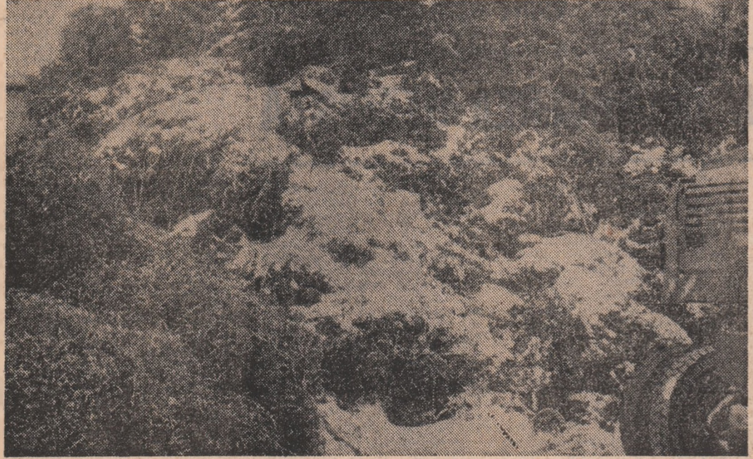
Firește că pentru a expediția fierului vechi necesar cuptoarelor este în primul rând nevoie ca acesta să fie colectat. Aceasta însă nu este totul, sortarea riguroasă, pe categorii (oțel, fontă, cupru, aluminiu și altele) fiind de asemenea obligatorie așa cum dealțfel procedă marea majoritate a întreprinderilor. Marșul majorității, nu însă și C. S. Galați, I.C.M.P. București sau