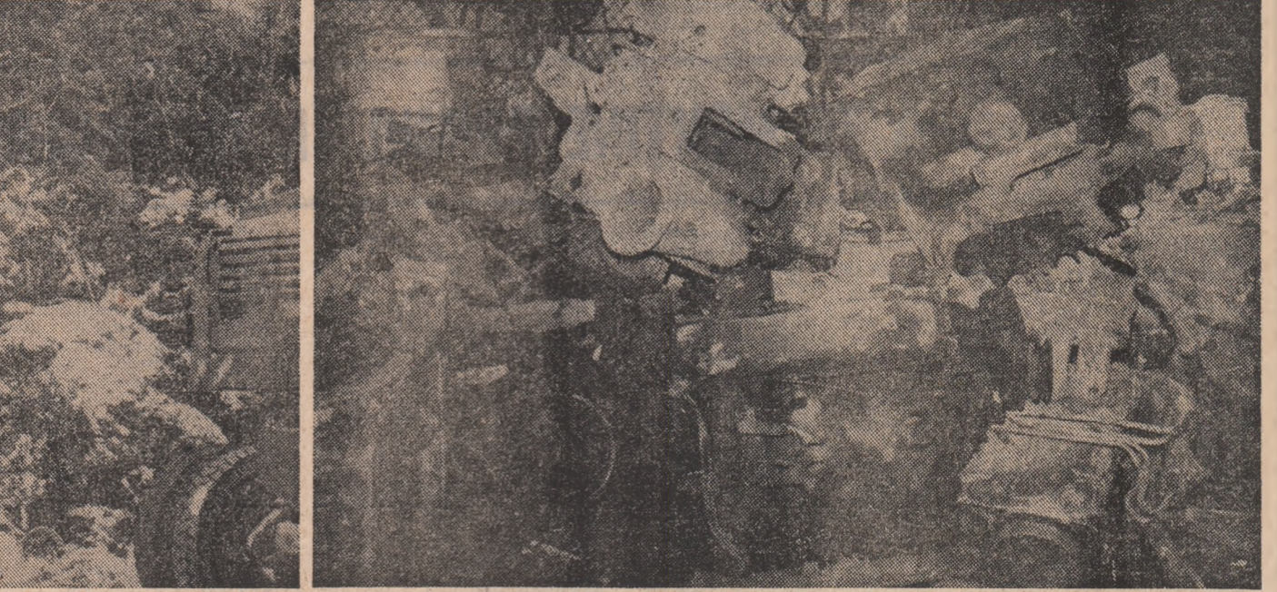
I.J.R.V.M.R. Vrancea — ca să luăm numai câteva exemple „fierului vechi” — unități care, neglijând total obligația de a livra numai materiale sortate, în loc să trimită spre oțelării — via Uzina Bercești — 125 tone fier vechi, au trimis la gunoi, sub zăpodă, tot atâtea tone de spuză compromișă, nerecuperabilă. Aceasta este cu atât mai grav cu cât amestecarea feroaselor cu neferoase și