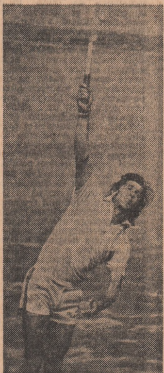
Doi aşi: Ilie Năstase şi serviciul său!