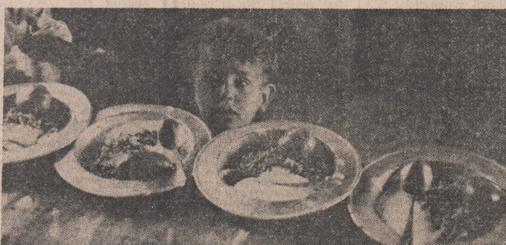
experții F.A.O. au întocmit o hartă mondială a solurilor, însoțită de un inventar al tipurilor de climat și de resursele de apă ale planetei. În funcție de acesti parametri au fost definite trei „scenarii”: unul — „sărăci” altul — „intermediar” și al treilea — „intensiv”.

Potrivit datelor O.N.U., aproximativ jumătate de miliard de persoane pe glob sînt sistematic subalimentate. Aceasta în timp ce aproximativ 40 la sută dintre femeile care trăiesc în S.U.A. și 32 la sută dintre concetenii lor bărbați au mai ales între 40 și 49 de ani, o greutate excedentară. Banca