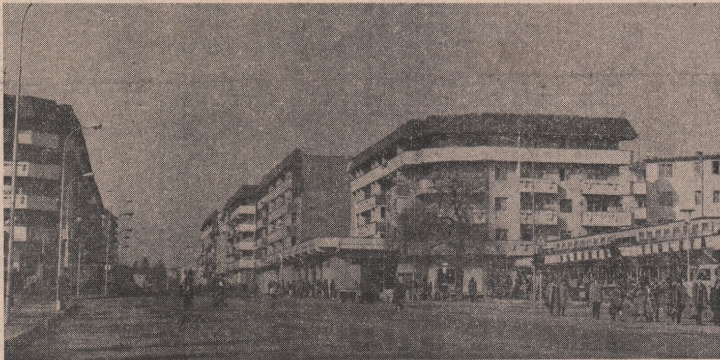
Imagine din Cimpina