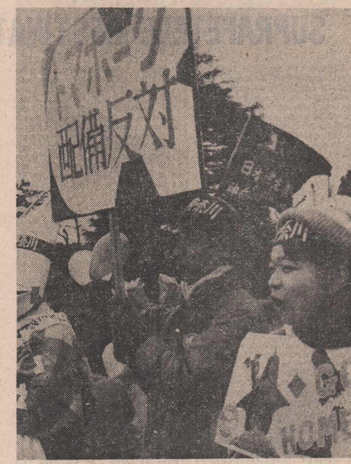
JAPONIA — Imagine din timpul unei demonstrații desfășurate în orașul Yokosuka, împotriva aportului soriilor în acest port a unor nave americane de bordul cărora se află rachete nucleare Cruise

Referitor la relațiile Est-Vest, el a relevat că miniștrii au subliniat necesitatea „unor contacte cit mai numeroase și mai frecvente” cu U.R.S.S. S-a convenit asupra necesității de a se favoriza dialogul, atât prin contacte bilaterale, cit și prin eforturi în cadrul forumurilor internaționale importante de la Stockholm, Viena și Geneva.