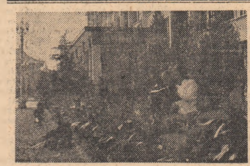
Însemnări din R. P. Chineză

Unul dintre cei mai mari scriitori ai Chinei, animatorul Mișcării Noii Culturii Chineze și multi alții. Proclamarea Republicii Populare Chineze a adus un suflu înnoitor în existența Universității din Beijing, deschizând calea unor ample și profunde prefaceri revoluționare. Universitatea a devenit un factor activ, de prim ordin, în strategia partidului comunist de transformare a sistemului și conținutului activității de educație