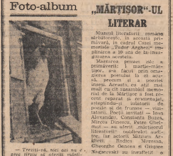
Trezit-vă, nici azi nu e prea tîrziu să oferiți mărțișoare!