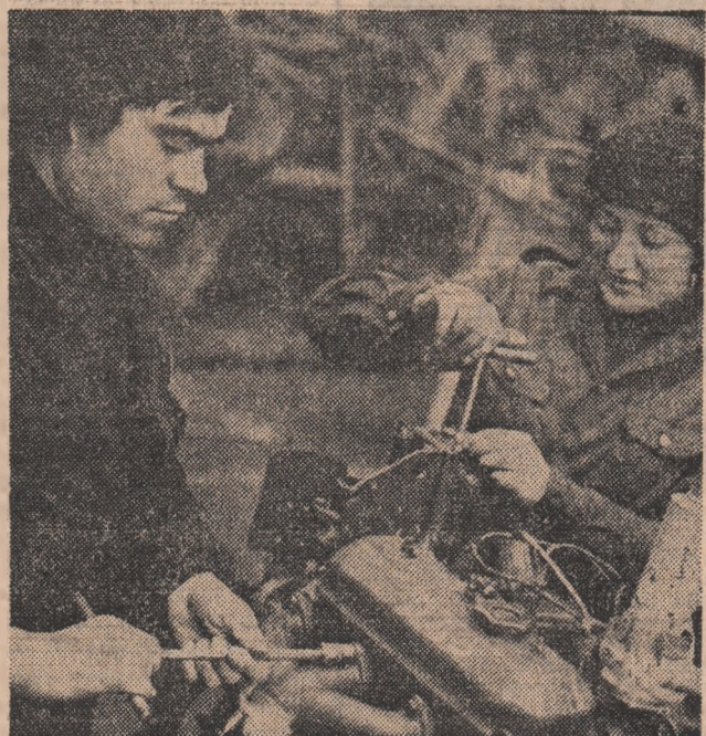
În secția de montaj general de la Întreprinderea „Tractorul” Brașov